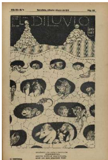
©Arxiu Històric de la Ciutat de Barcelona. Bru-Net El Diluvio.

La singular estructura de l'edifici i la relació entre Gaudí i Milà són objecte d'acudits publicats en revistes satíriques de l'època.