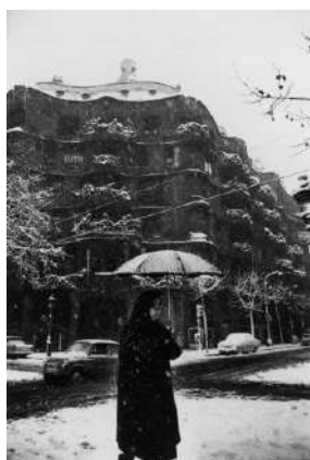
Autor: Xavier Miserachs

La Immobiliària Provença encarrega a l'arquitecte Francisco Juan Barba Corsini la construcció de tretze apartaments a les golfes de l'edifici, i també la transformació del primer pis del carrer de Provença en quatre apartaments de 100 m 2 cadascun.